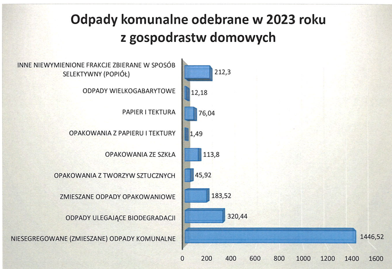
Rysunek 1. Ilość odpadów odebranych w 2023 roku z gospodarstw domowych.